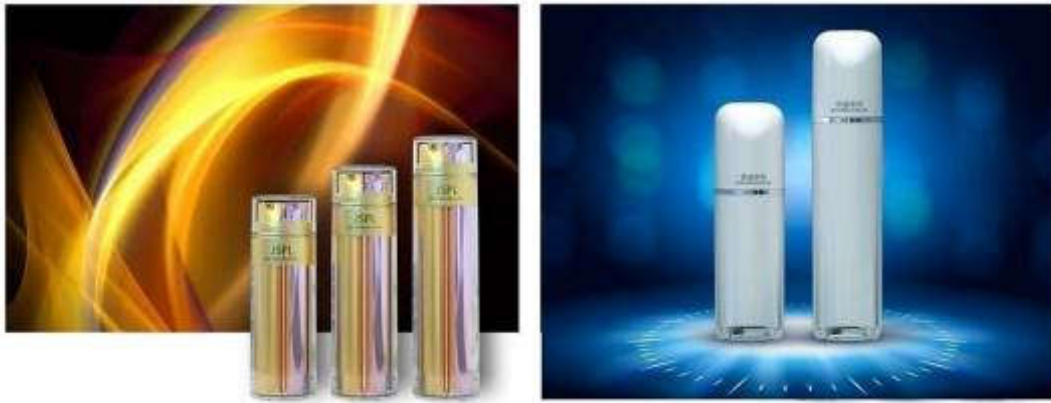
乳液瓶系列产品示意图