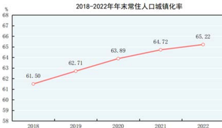
数据来源：国家统计局

根据国家统计局数据显示，全国居民人均可支配收入持续增长。截至 2022 年底，我国居民人均可支配收入已达 36,883 元，比上年增长 2.9%。居民人均可支配收入的持续上升，为人们追求居住环境的安全、舒适、健康、便捷提供了经济基础，推动了老旧小区的智慧化改造和新建社区的智慧化提升。在新型城镇化的方针指导下，智慧城市和智慧社区建设成为了实现“人民对美好生活的向往”奋斗目标的重要路径。同时，各地住房和金融政策纷纷出台，进一步满足了居民正常住房消费的愿望和需求，城市住房需求特别是改善性住房需求有望持续释放，智慧社区行业的发展潜力巨大。