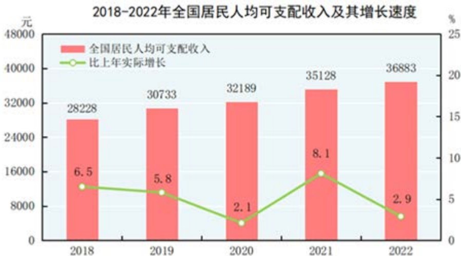
数据来源：国家统计局

根据国家统计局数据显示，全国居民人均可支配收入持续增长。截至 2022 年底，我国居民人均可支配收入已达 36,883 元，比上年增长 2.9%。居民人均可支配收入的持续上升，为人们追求居住环境的安全、舒适、健康、便捷提供了经济基础，推动了老旧小区的智慧化改造和新建社区的智慧化提升。在新型城镇化的方针指导下，智慧城市和智慧社区建设成为了实现“人民对美好生活的向往”奋斗目标的重要路径。同时，各地住房和金融政策纷纷出台，进一步满足了居民正常住房消费的愿望和需求，城市住房需求特别是改善性住房需求有望持续释放，智慧社区行业的发展潜力巨大。