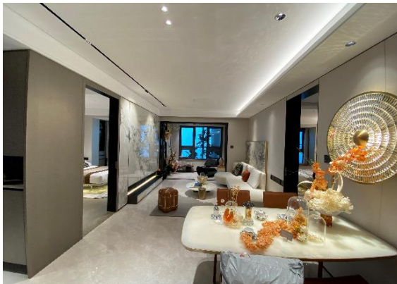
公司产品在住宅的应用