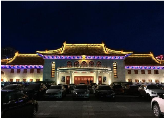
公司产品在户外亮化的应用