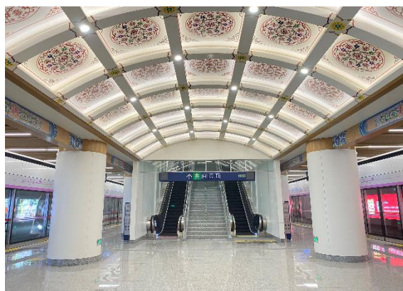
公司产品在地铁的应用