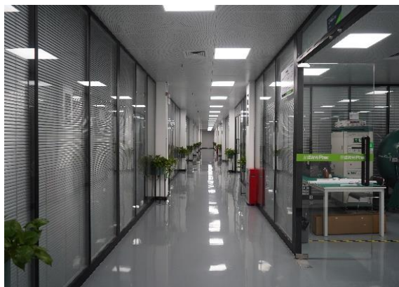
图：公司新建实验室与检测中心局部