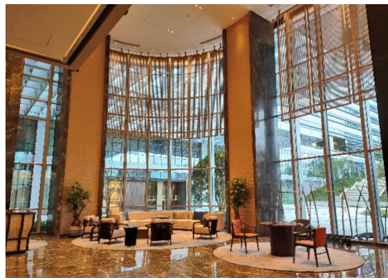
公司产品在酒店的应用