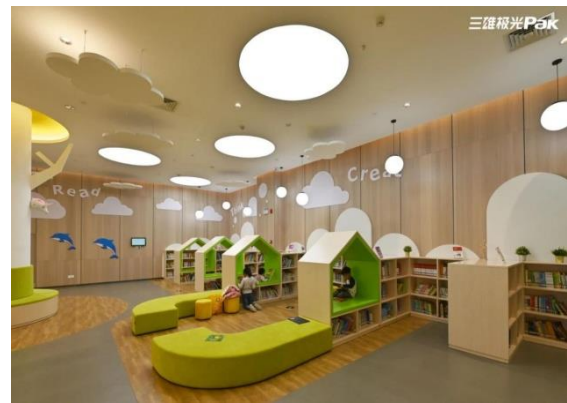
公司产品在图书馆的应用