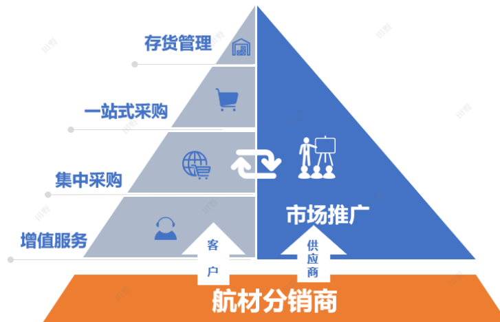
航材分销经营模式

公司作为链接产业链上下游的重要纽带，一方面可以协助部分上游供应商原厂完成产品开发与推广，并利用良好的下游客户关系协助供应商产品在不同机型上进行测试认证。另一方面公司所提供的航材产品供应及配套服务能够协助提升下游客户的运营管理效率，节约航材采购成本，公司经验丰富的业务团队还为客户提供优质的售前、售后服务及技术支持。