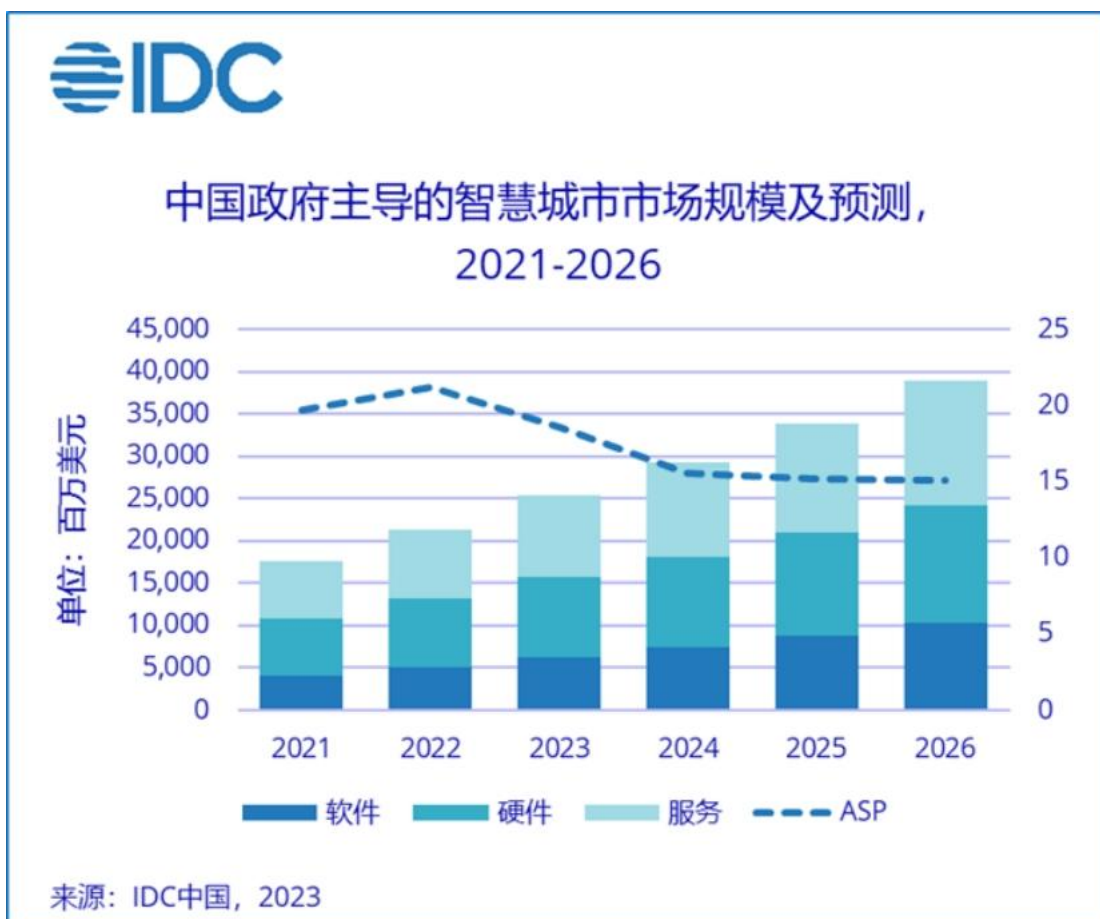
图表：IDC 对中国智慧城市市场规模的预测

智慧城市的出现和建设发展顺应了国内政策、社会、技术和实践背景。从增速看，IDC 预计 2020-2024 年全球智慧城市市场 CAGR 为 13.7%，而 2020 年中国总支出同比增长 12.0%，未来五年 CAGR 有望达 16.9%，高于全球平均水平。IDC 近日又发布了《IDC FutureScape：全球智慧城市 2023 年预测——中国启示》，对中国智慧城市市场规模进行了预测，到 2026 年中国政府主导的智慧城市 ICT 市场投资规模将达到 389 亿元人民币，2022 - 2026 年的年均复合增长率为 17.1%（备注：IDC 定义的智慧城市市场包括智慧政务、智慧应急、智慧交通、智慧校园、智慧环保、智慧警务等子市场）。