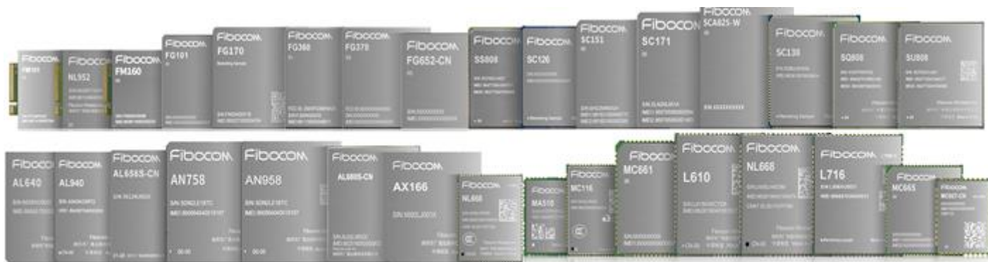
图 2：公司主要产品图片

公司自成立以来一直致力于物联网与移动互联网无线通信技术和应用的推广及其解决方案的应用拓展，在通信技术、射频技术、数据传输技术、信号处理技术上形成了较强的研发实力，是无线通信技术领域拥有自主知识产权的专业产品与方案提供商。公司在物联网产业链中处于网络层，并涉及与感知层的交叉领域，主要从事无线通信模块及其应用行业的通信解决方案的设计、研发与销售服务。