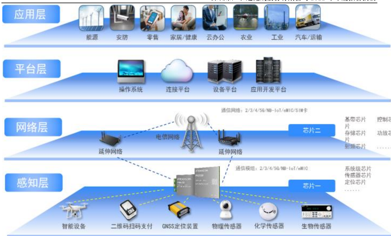
图 1：物联网产业链及架构

公司自成立以来一直致力于物联网与移动互联网无线通信技术和应用的推广及其解决方案的应用拓展，在通信技术、射频技术、数据传输技术、信号处理技术上形成了较强的研发实力，是无线通信技术领域拥有自主知识产权的专业产品与方案提供商。公司在物联网产业链中处于网络层，并涉及与感知层的交叉领域，主要从事无线通信模块及其应用行业的通信解决方案的设计、研发与销售服务。