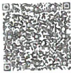
本证书年检二维码

本证书经检验合格，继续有效一年。 This certificate is valid for another year after this renewal.