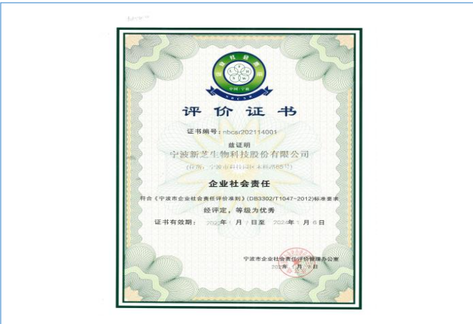
公司获评企业社会责任评价“优秀”等级

2022 年 10 月 10 日，宁波新芝生物科技股份有限公司成功在北京证券交易所上市，成为宁波市首家通过北交所注册制发行上市的企业。