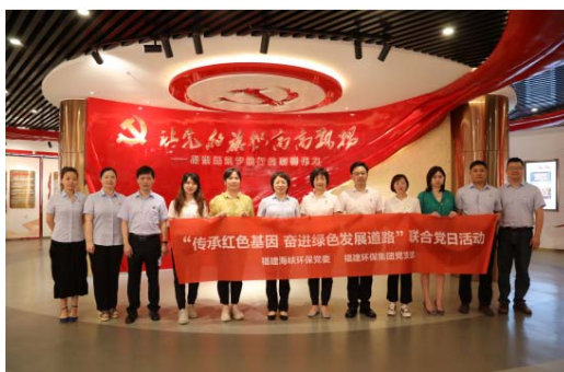
“喜迎二十大，奋进新征程”主题活动

公司党委通过开展形式多样的党员教育活动和主题党日活动，主动团结群众中的积极分子，走进基层行项目，走进田间地头，到生产一线去，与体现正能量的各行各业先进标杆做共建、同进步。报告期内，公司积极开展“喜迎二十大，奋进新征程”、“老物件中忆党史，新时代里传基因”为主题的物件实物展、“护河爱水、清洁家园”等主题党日活动。