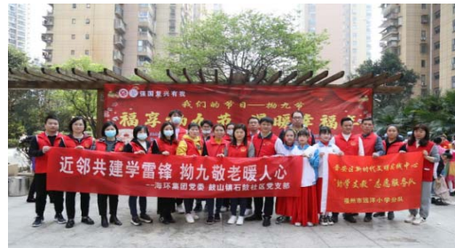
公司联合石鼓社区开展拗九节活动

公司联合石鼓社区党支部，组织党团员志愿者在远东丽景小区开展“近邻共建学雷锋 拗九敬老暖人心”主题党日活动，在“拗九节”来临之际，为社区老人送上一碗温暖的拗九粥，传承拗九孝亲节民俗文化，弘扬孝亲敬老传统美德。