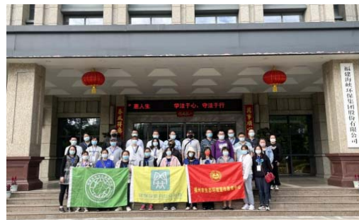
六五环境日环保设施向公众开放活动

福州市生态环境宣传教育中心、鼓楼区洪山镇人民政府环境办及福建省环保志愿者协会组织洪山镇社区环境管理者前往洋里污水处理中心，开展福州市环保设施和城市污水垃圾处理设施向公众开放活动。同时公司积极响应福州市委号召，落实“万名干部向基层”行动，积极投身志愿者服务行列，展现上市企业的社会责任和国企担当。