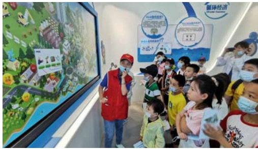
小朋友们在参观环保科教馆

公司依托全国首批对公众开放的环保设施——洋里污水处理中心，借助其生产工艺先进多样、厂区建设环境友好高标准以及常年对公众开放的实践经验优势，对厂区重新进行区域功能定位，提炼出污水处理回用和固废循环利用两大环保主题，把厂区划分为“一核”（绿水青山文化观光园）、“一轴”（污水处理观光轴）、“两区”（生产工艺观光区和循环经济观光区）和“两带”（城市生态水系保护观光带和城市肌理观光带）。为配套科普研学和工业旅游，公司还设计建设观光服务中心、企业文化主题馆和环保科教馆等多个主题场馆；并在此基础上，开发系列文创产品和以污水处理、循环利用为主题的环保课程，创新增加“污水处理厂设立论证会”模块，推动参与者对环境保护与城市建设之间的关系有更深了解；现场试验操作，包括自主设计工艺流程、3D打印实验设备、显微镜观测微生物菌群等，全力打造融观赏性、科普性、趣味性于一体的工业旅游和环保研学基地。