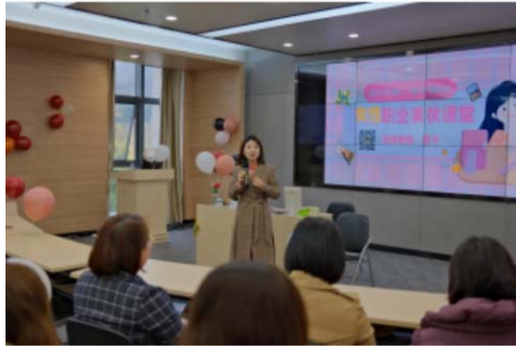
开展女性职业美妆课堂