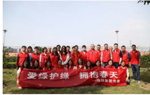
“爱绿护绿 拥抱春天”主题活动

报告期内，公司开展“呵护脾胃，长命百岁”职工脾胃健康沙龙活动，提高公司职工对脾胃健康的认知与关注，引导树立科学预防疾病的理念；在“植树节”月，开展了以“爱绿护绿 拥抱春天”的主题活动；开展“三伏灸”中医保健活动，提升员工健康指数；开展“轻盈99”健康瘦身沙龙活动，营造“健康生活，快乐工作”的浓厚氛围；开展以万家无“幽”，呵护“胃”来为主题的幽门螺旋杆菌检测活动，普及幽门螺旋杆菌有关健康知识；开展“提升女性魅力，展示巾帼风采”主题女性职业美妆课堂；组织职工参加职工疗养活动；“海环杯”建废资源化板块职工技能竞赛，不断提高人才队伍素质。通过一系列主题活动，促进职工群众身心健康，满足职工群众对美好生活的向往。