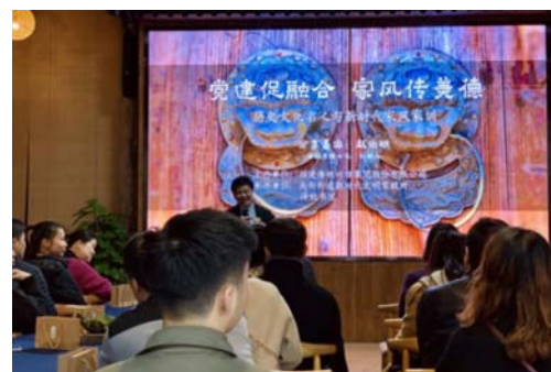
“党建促融合，家风传美德”讲座