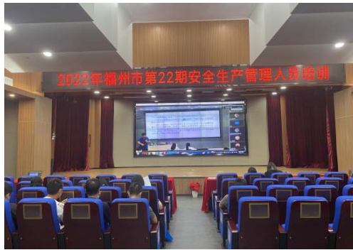
安全生产管理人员培训