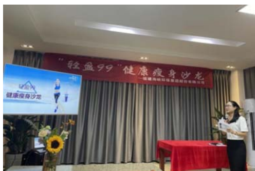
“轻盈99”健康瘦身沙龙活动

公司关注职工身心健康并积极举办丰富多彩的文体活动，以此贯彻和谐、惜福、卓越、自励的海峡环保员工行为准则，培育员工积极向上的价值观和社会责任感。