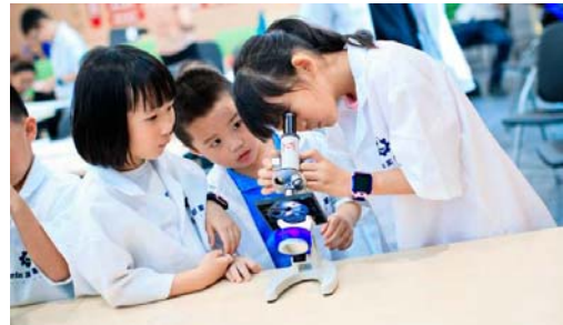
“小小工程师”观察污水中的微生物