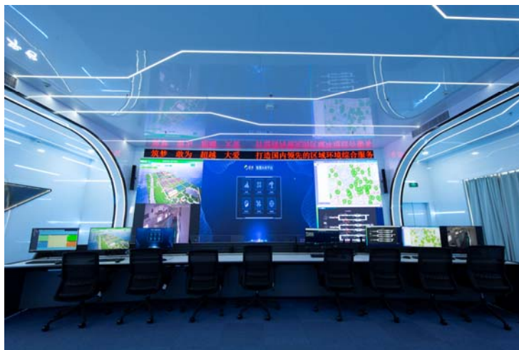
海峡环保智慧平台

公司着力打造江苏海峡环保科技发展有限公司致力于将水处理工艺技术、运营技术与新一代人工智能技术跨界融合，构建基于水务技术的全流程、全生命周期、全息智慧系统，真正实现安全生产、稳定达标、节能降耗三大运营目标，打造智慧运营新生态。报告期内，公司不断加强“智慧水务”建设，积极梳理公司所属污水处理厂历史数据等运营管理基础信息，导入公司自主研发的海环智慧污水处理运营管理平台并上线使用，能够实现生产管理数字化、工艺运行智能化、分析决策智慧化，有效提高公司运维管理效率。