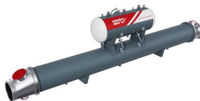
卧式布置余热锅炉