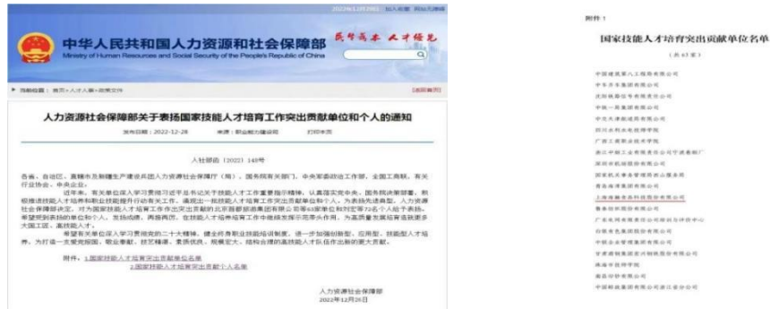
图注：荣誉为国家技能人才培育突出贡献单位