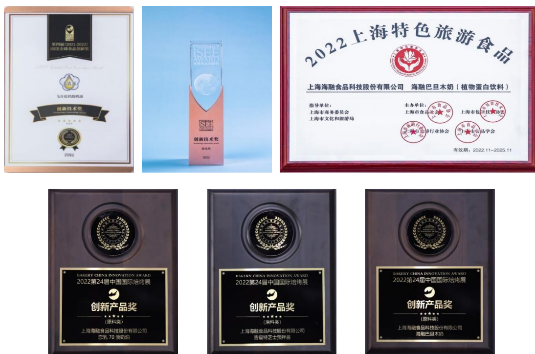
图注：荣誉证书先后为 iSEE 全球食品创新奖-飞青花奶酪奶油；2022 上海特色旅游食品—海融巴旦木奶；2022 第 24 届中国国际焙烤展创新产品奖-恋乳 70 淡奶油、吉福特芝士预拌酱、海融巴旦木奶；

品。随着植物基饮食观念在全球兴起，公司努力探索人与自然和谐共生之道，为烘焙行业发展持续提供绿色方案。公司推出了 0 乳糖 0 动物脂肪 0 反式脂肪的飞蛋植物基坚果奶油系列。是关注碳排放、引领健康轻食热潮，倡导轻饮食，拥抱轻生活，追求健康生活方式的人群需求，同时满足消费者要健康、好吃、有趣的产品，也为身体与地球减负。随着创新饮品的思考和大胆尝试，海融科技在植物基赛道持续发力，推出了适合潮流茶饮的植物基巴旦木奶代替牛奶应用在饮品中，为行业提供了更多有益地球可持续发展的解决方案。公司产品先后获得多个奖项：飞青花奶酪获评 iSEE 全球食品创新奖；恋乳 70 淡奶油、吉福特芝士预拌酱、海融巴旦木奶获评 2022 第 24 届中国国际焙烤展创新产品奖；海融巴旦木奶获评 2022 上海特色旅游食品。