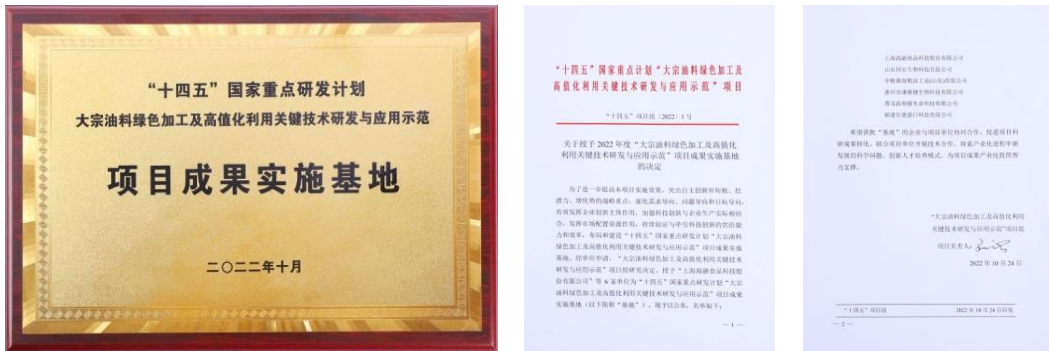
图注：荣誉为“十四五”国家重点研发计划项目成果实施基地

2022 年，海融科技被授予为“十四五”国家重点研发计划“大宗油料绿色加工及高价值化利用关键技术研发与应用示范”项目成果实施基地。海融科技还荣获了国家人力资源和社会保障部发布的“国家技能人才培养突出贡献单位”。