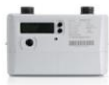
民用超声波燃气表

超声波计量仪表是利用超声波在介质中传递的时间差进行计量的新型计量仪表，它是一种高可靠性、高精度、带温压补偿的全电子式仪表。公司充分运用超声波计量技术精度高、易于实现智能化等特点，向运营商提供全电子一体化的先进计量解决方案，满足运营商对计量终端设备长期保持计量准确度的要求，凭借实时温度补偿、耐低温、宽量程等技术优势，改善运营商供销差问题，全面解决日常计量、用气安全监测、漏损监测等需要。