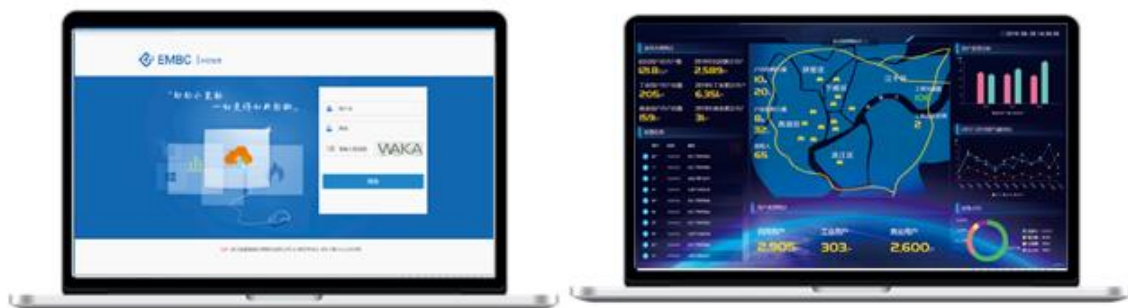
燃气云客户管理系统