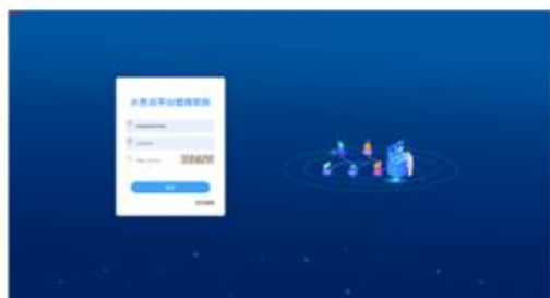
水务云客户管理系统