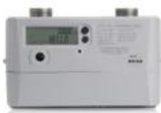
商业超声波燃气表