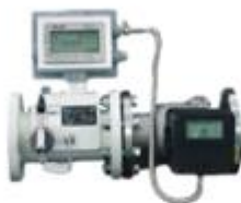
工业智能燃气流量计（控制器）