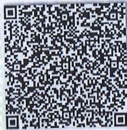
专业的手机二维码

本证书经检验合格，继续有效一年。 This certificate is valid for another year after this renewal.