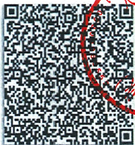
注册会计师年度注册二维码