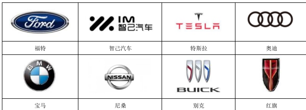
公司产品主要应用品牌

公司主要从事镁合金、铝合金精密压铸产品及配套压铸模具的研发、生产和销售。公司现有主要压铸产品包括汽车显示系统零部件、汽车座椅零部件、新能源汽车动力总成零部件、汽车车灯零部件、汽车中控台零部件等汽车类铸件以及电动自行车功能件及结构件、园林机械零配件等非汽车类铸件。