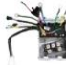
170 风冷增程器控制器