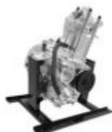
172 乘用车水冷增程器