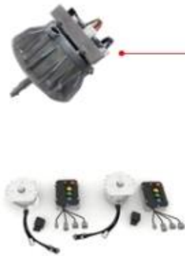
行走控制器及电机 (2.5kw及以下)