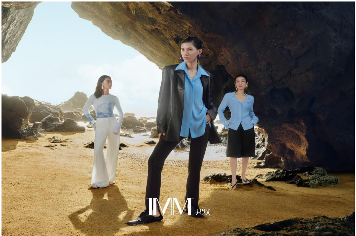
IMM 尹默 重庆北城天街店