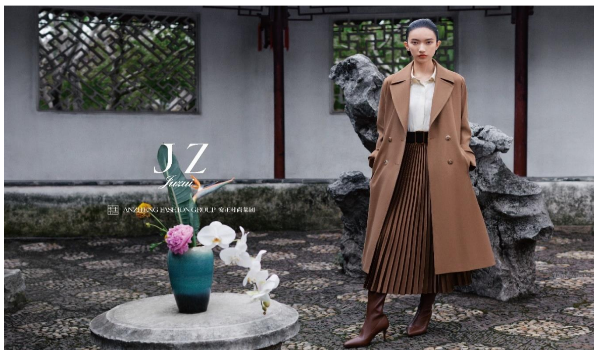
JZ 玖姿 苏州绿宝广场店