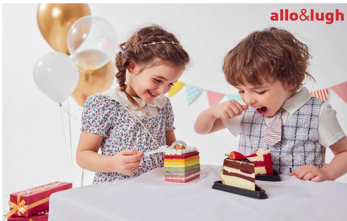
allo&lugh 阿路和如 重庆协信星光时代广场店