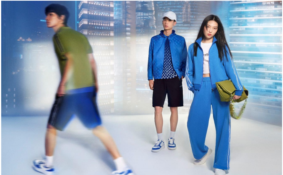
ANZHENG 安正 武汉武商 Ma11 · 国广店