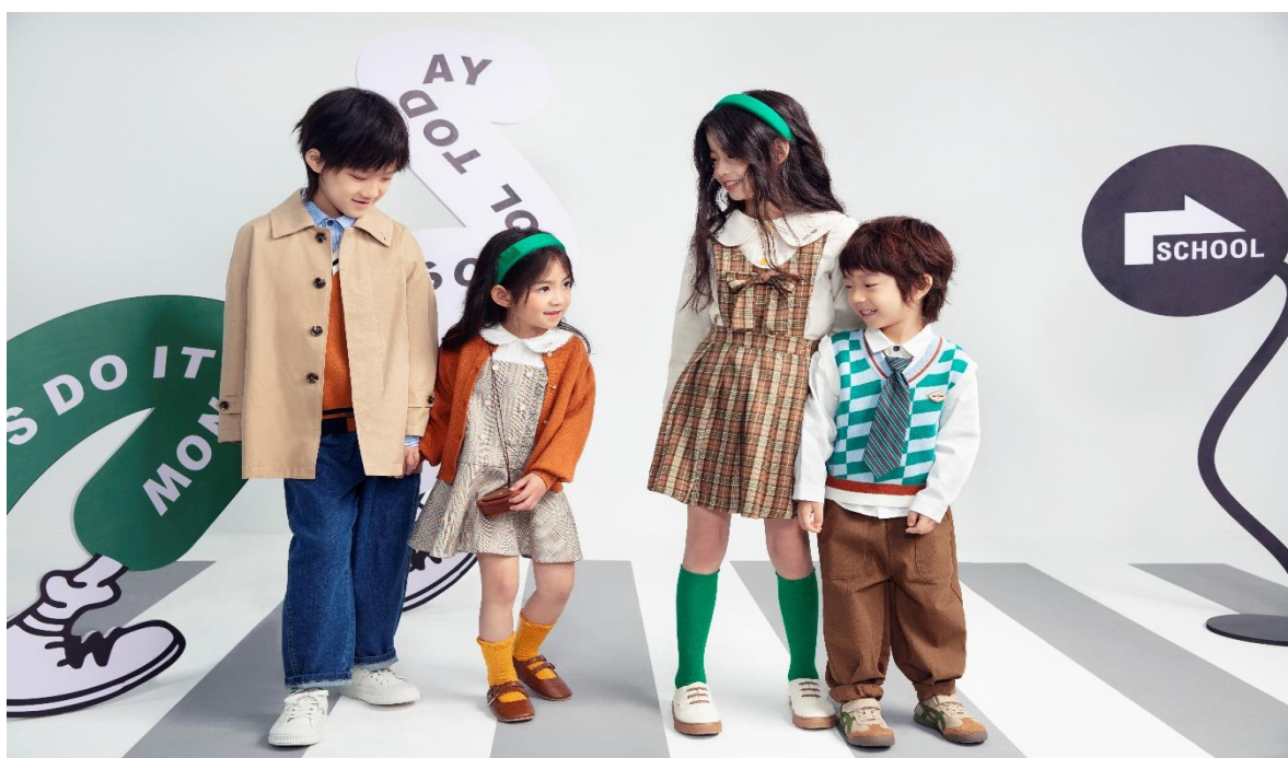
FROG PRINCE 青蛙王子 佛山市天安数码城店