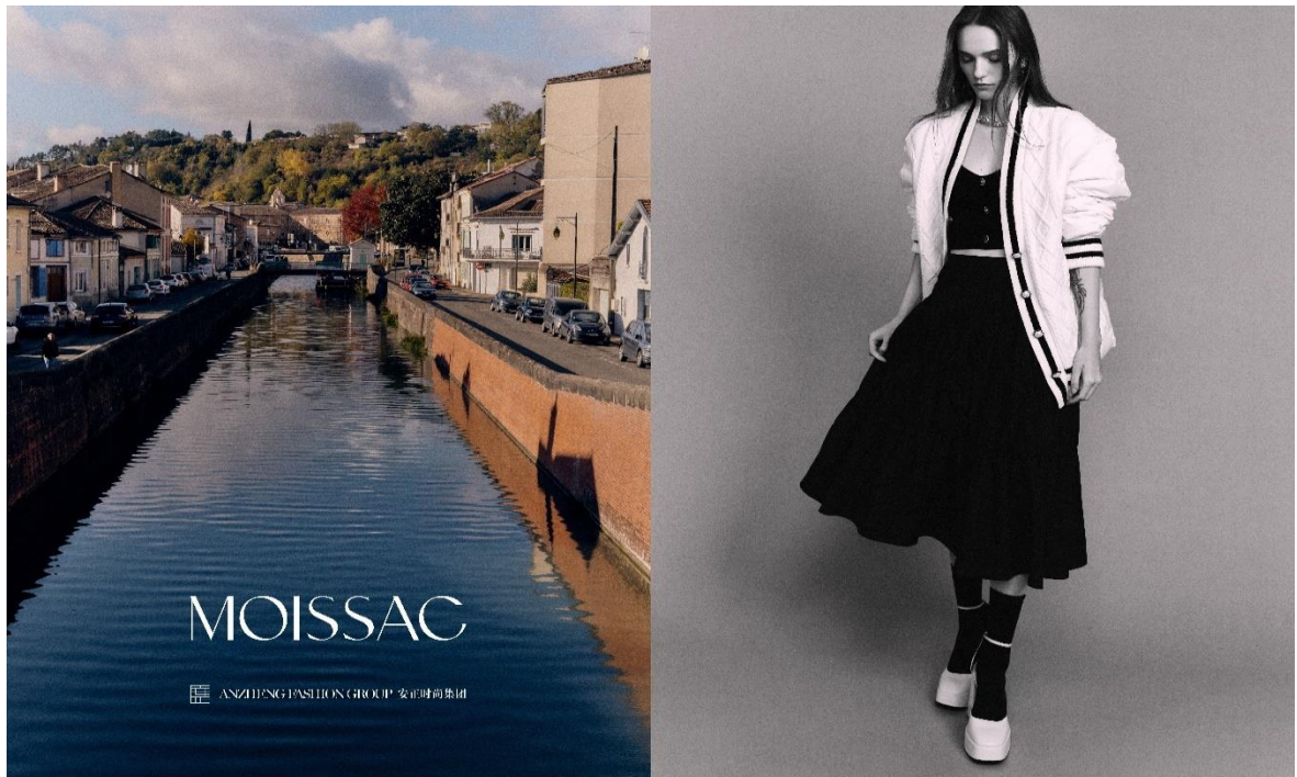
MOISSAC 摩萨克 北京朝阳大悦城店