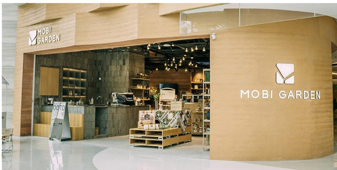
牧高笛露营生活馆

公司围绕年轻一代用户的消费习惯，注重线上天猫京东和抖音渠道的建设，也重视线下新兴渠道的开拓。报告期内，公司各类渠道均获得快速发展，其中抖音、KA 卖场等新兴渠道出现高速增长。2022 年 6 月，公司开设全国首家装备线下一站式户外体验店，在展示露营文化的的同时，为用户提供更加多元的购物体验。