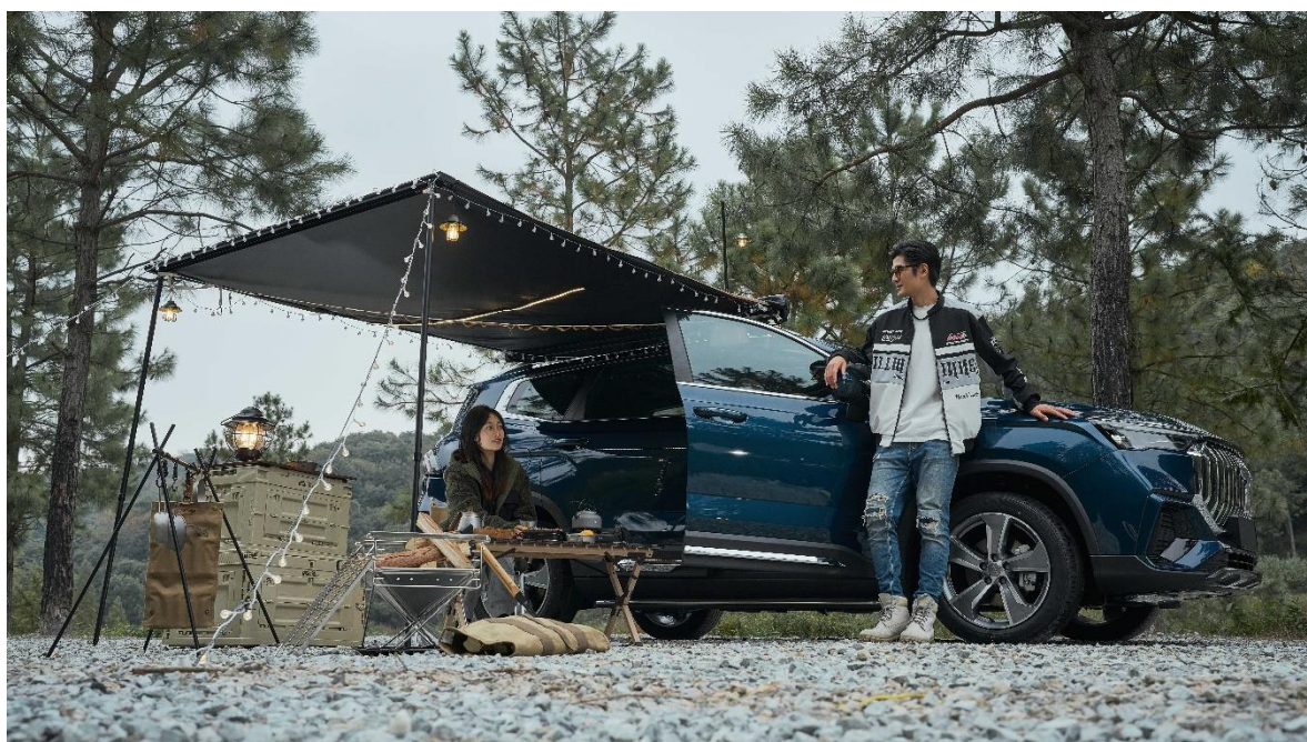
牧高笛 X 吉利汽车联名车载侧边天幕

汽车是露营的载体，公司通过与车企的联动，将追求高品质出行的露营文化延伸至汽车文化之中。