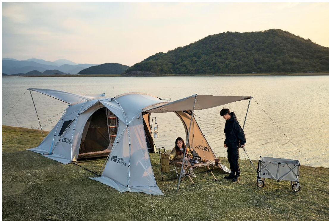
牧高笛隧道帐篷假日星空系列

风格上丰富场景，从产品线上细化产品。未来公司将持续品类创新，进一步丰富全品类矩阵，聚焦产品功能性、轻量化、个性化，解锁更多露营新场景。