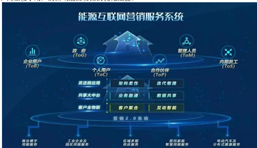
图 1 能源互联网营销服务系统示意图

报告期内，完成 营销 2.0 统一软件研发，攻克了大型复杂应用软件基础设施云化、业务中台化、应用场景化动态编排等系列技术难题，完成浙江、安徽等地营销 2.0 建设实施。支撑 网上国网 建设，建成公用事业领域最大的线上服务平台，成为能源行业应用排名第一、国资央企旗下名列前茅的 APP 产品，沉淀了“刷脸办”“一证办”等便民服务及多款特色微服务，搭建首家与国家政务服务平台贯通的国有企业服务专区，实现网上国网由项目建设向产品运营转型。打造 企业级工单中心 产品，可实现工单状态、提醒、预警、评价等全流程闭环管控，为用户构建便捷化工单获取窗口，已在重庆成功打造示范样板并在电网市场内推广，获评数字化专项示范优秀成果。开展 智慧变电站 场景应用的市场拓展，承建国网江苏省公司等多座变电站远程智能巡视建设。参与 新型电力负荷管理系统 研发攻坚，参与规划设计及平台建设，承建了国网总部和天津、冀北、辽宁等 7 个省公司的系统建设任务，其中自主研发的统一汇集组件在国网总部及 27 个省公司实现落地应用，实现电网生产运行领域新突破。同时，公司承接新型电力系统负荷精准调控科技项目课题，该项目入选国网十大重点科技项目之一。推进 电力市场化交易 业务规模化发展，依托自主研发的“电享家”数字化能源平台，已为 2500 余家客户提供电力交易服务，交易电量超 69 亿千瓦时。参与 虚拟电厂 相关示范工程建设，打造覆盖“源网荷储充”一体化运行虚拟电厂运营平台，平台已接入华北辅助服务市场、天津虚拟电厂、上海虚拟电厂参与电网调节，实现面向企业园区、商业楼宇用户的区域能源资源的优化配置。