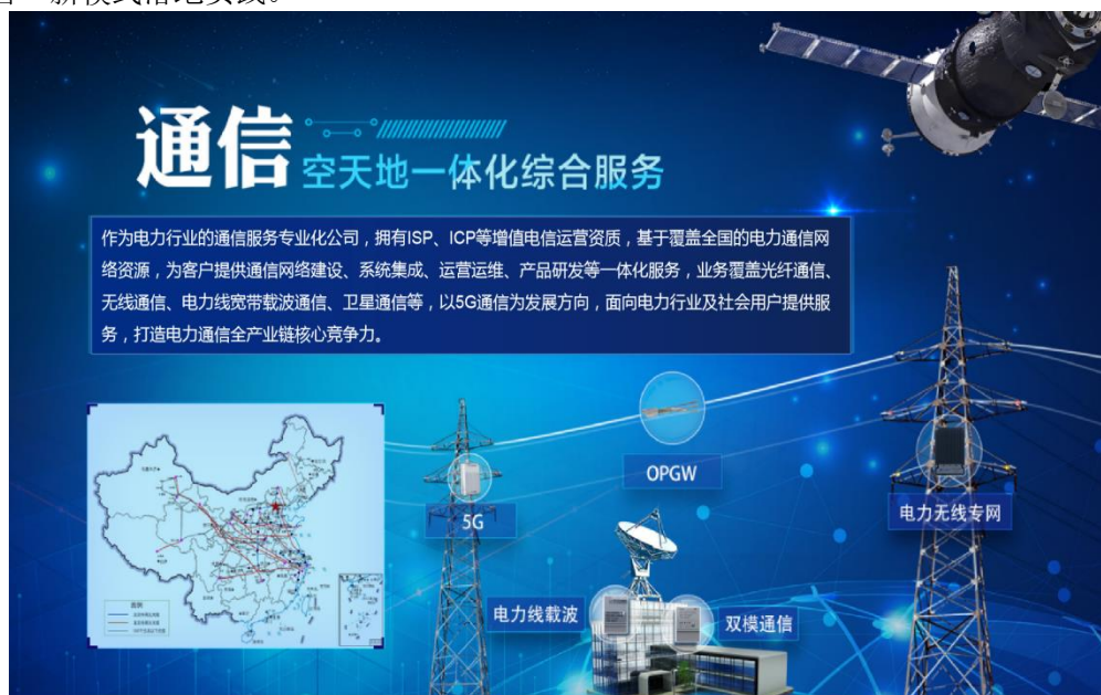
图 4 通信空天地一体化综合服务示意图

三是夯实云网基础设施板块业务根基。 持续夯实通信网络、算力基础设施以及包括云平台、数据中台、物联管理平台在内的“三台”建设能力，并在智能终端等核心技术产品方面持续加大投入，不断加强增值电信业务运营、云数据中心运营能力，持续保有并争取进一步扩大存量市场规模。以创新推动 通信 主业转型升级，逐步构建起“空天地”通信网络建设运营体系，开展 5G 公网等“空基”规模化应用，加快卫星通信承载网等“天基”通信体系建设，支撑应急管理体系和电力卫星物联网应用，持续提升高效能数据传输平台等“地基”建设运营能力，进一步激发通信资源效能。深挖能源大数据产业价值，建立外部数据与电力数据共享共用的新型商业模式。夯实 企业中台 已有业务基础，建立发展、财务、设备等专业领域的总部、省侧两级数据产业市场，筑牢企业中台产业根基。加强未来城云数据中心、合肥云网基础平台软硬件系统建设项目的运营管理，探索 数据中心 绿色节能改造、业务整合迁移等新业态，加强运营运维集成业务规模，推动“建设+运营”新模式落地实践。