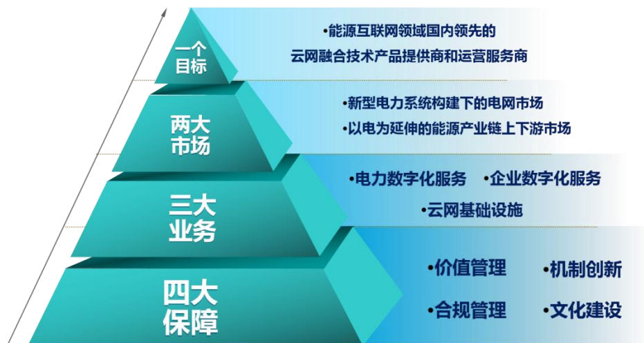
图3 “1234” 总体发展思路示意图

深入贯彻落实党的二十大精神及“双碳”、新型电力系统构建等国家战略，以公司“十四五”发展规划为指引，围绕公司“数字底座+能源应用”为核心定位的“云网融合”产业布局，坚持以支撑能源数字化转型为抓手，按照“1234”总体发展思路，即“ 瞄准一个目标、聚焦两大市场、夯实三大业务、落实四个保障 ”，以成为能源互联网领域国内领先的“云网融合”技术产品提供商和运营服务商为目标，聚焦新型电力系统构建下的电网市场和以电为延伸的能源产业链上下游市场，继续做大做强电力数字化服务、企业数字化服务、云网基础设施服务 三大板块业务 ，实施价值管理、机制创新、合规管理、文化建设 四大保障策略 ，夯实通信运营、企业中台、系统集成、运维服务、电网客服、智慧办公等传统优势业务，加快电力交易、双碳服务、新型负控、智慧水电、人工智能、信创等重点布局业务，打造能源数字化原创技术“策源地”和“云网融合”产业链“链长”，进一步提高公司核心业务的发展质量和整体效益，不断增强公司核心竞争力，推动公司高层次、高质量、高效益发展。