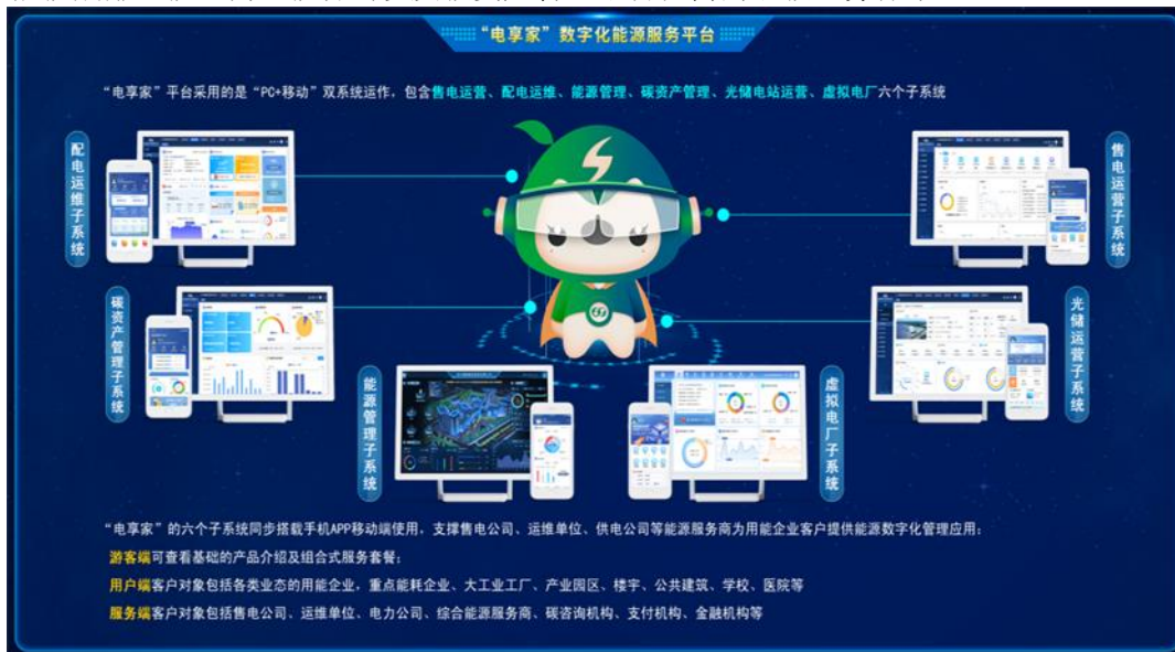
图 2 “电享家”数字化能源服务平台

在公司“双碳”业务战略引领下，构建了基于环境属性的绿色电力交易体系，支撑国家电网公司北京电力交易中心绿色电力证书交易系统成功上线。可再生能源电力消纳凭证交易系统可为国网 27 家省公司提供凭证交易服务，成交电量 73.5 亿千瓦时，该平台荣获中国节能协会“碳中和先行示范奖”。支撑国家电网公司承建全国碳排放监测服务平台，完成核心功能“电碳分析模型”研发部署，完成“电-碳”市场发展推演及省间电力交易关键问题研究管理咨询项目，逐步夯实包括碳减排、碳监测、碳咨询以及碳资产管理平台在内的双碳业务体系。