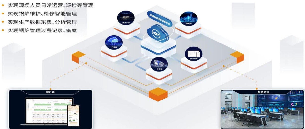
图 2: 物联网运营平台