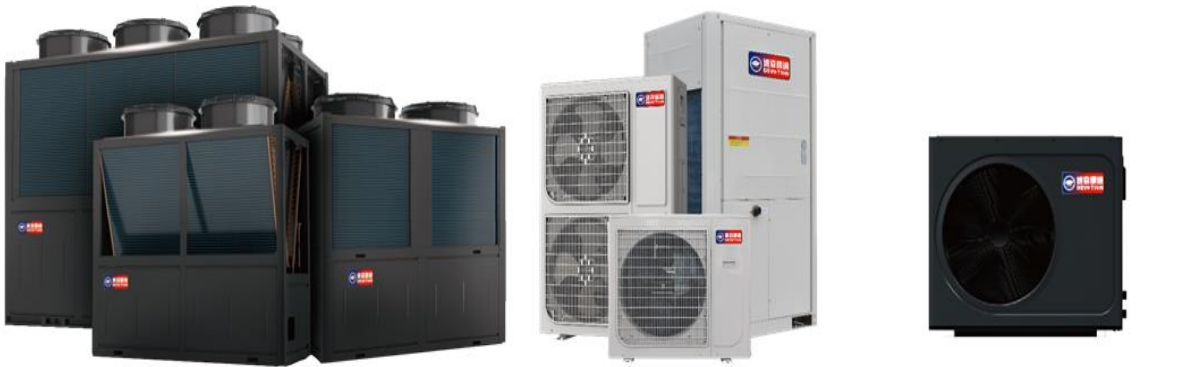
商用超低温空气源热泵模块机