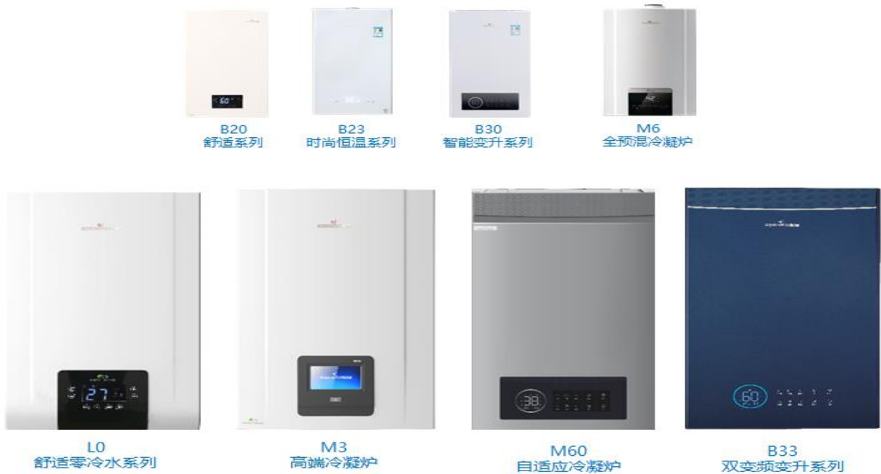
图 6：“小松鼠”壁挂炉系列产品

迪森家居基于工业物联网技术，创新融合智能舒适家居产品生态体系，结合大数据和人工智能技术，通过自动采集室内环境中的温度、湿度、新风量、洁净度、水温、水质软硬度等数据，实时反馈数据信息，实现远程控制。并可通过收集、分析用户行为数据、室内环境等自我学习，提供个性化舒适度解决方案。