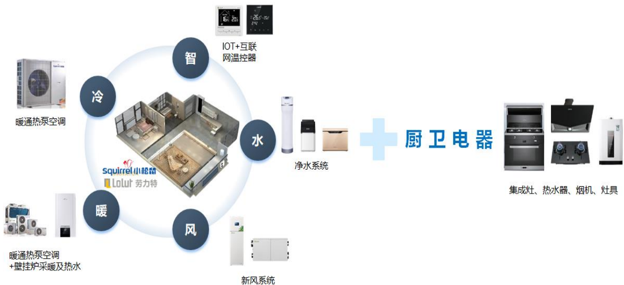
图 3: 冷暖风水智+厨卫 (舒适家解决方案)

公司智能舒适家居围绕“冷、暖、风、水、智”五大元素,致力于为用户提供健康、舒适、智能的家居系统解决方案。通过热泵暖通空调、壁挂炉采暖及热水、全屋新风、全屋净水四大系统进行自主平衡,智能融合舒适家居“温、湿、氧、风、洁、静”的恒适环境,为用户打造安全便捷、舒适健康、节能环保的人性化家居环境。