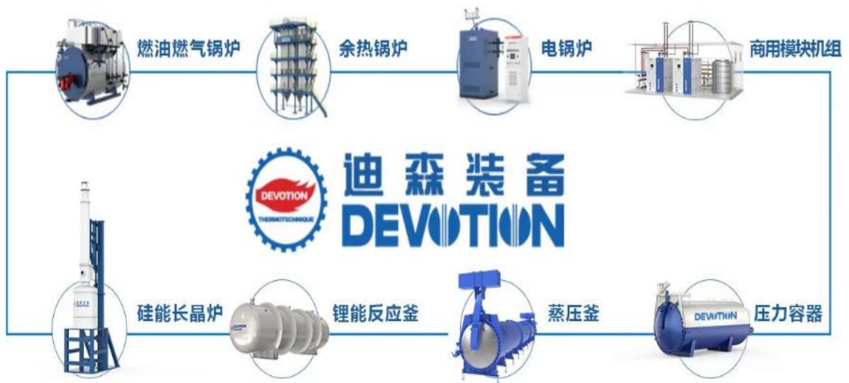
图 1: 清洁能源装备系列产品

公司专注新能源及清洁能源应用装备的研发和制造, 实行“以销定产”的经营模式, 为客户提供新能源装备、热力、蒸汽、采暖等多样化能源装备综合解决方案。其中新能源装备产品包括光伏设备结构件 (单晶炉腔体、蓝宝石炉腔体及铸锭炉腔体等)、锂电池设备; 清洁能源装备产品主要有釜类容器产品系列 (如蒸压釜、玻璃蒸压、热压罐、渔网釜) 及锅炉产品系列 (如电锅炉、余热锅炉、生物质锅炉、商用锅炉、天然气锅炉) 等。公司拥有省市两级技术中心和热能工程研发中心, 是《燃气采暖热水炉》、《电加热锅炉技术条件》、《蒸压釜》等多项国家及行业标准主编单位, 并拥有机器人焊接生产线, 全面实现数字化下料、自动化焊接、标准化装配, 整个生产过程质量可控, 全新设计的冷凝锅炉系列产品, 可满足国家最新能效标准, 最严苛超低氮排放要求, 符合中国城镇化及燃气化进程, 高效的分布式供热趋势及日益严格的环保标准, 已广泛应用于钢铁、化工、汽车、纺织、食品、医药、酒店、学校、住宅、商业综合体蒸汽、采暖和热水供应, 充分满足用户多样性、个性化需求。专业的售前、售中、售后技术支持也可全方位帮助客户发现、识别并解决供热系统的各类问题, 保障系统长期稳定运行。