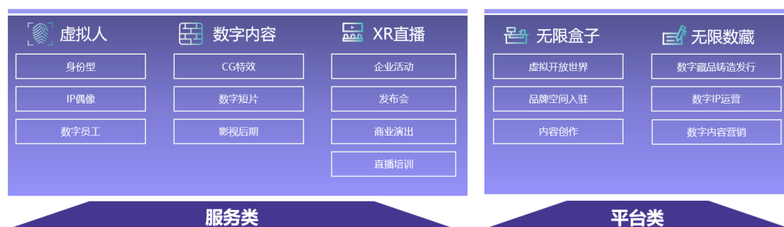
图：虚拟数字业务全景图

(2) 虚拟数字业务：公司依托专业级硬件设施和创作团队，帮助企业/品牌在新流量时代创建虚拟数字形象及衍生资产，搭建品牌商业化基建。运营团队将以客户需求为原点，提供创新式适用于多维度应用场景的内容运营及商业化解方案。目前公司虚拟数字业务主要分为服务类和平台类两大业务模块，可为客户提供数字人、数字内容、数字场景、XR 直播、数字藏品的制作、发行等服务，使品牌及其衍生资产在新流量时代进入消费者视野并最终沉淀到品牌流量池。