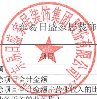
上海日盛家居装饰集团股份有限公司 2022 年度营业收入扣除情况表