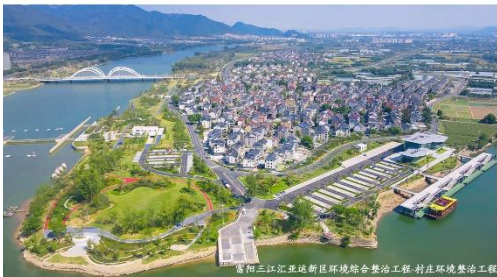
贵阳三江新区环境综合整治工程-村庄环境整治工程