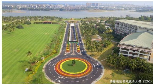
博鳌论坛景观提升工程（EPC）