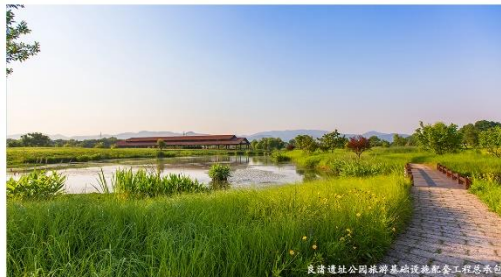
良渚遗址公园旅游基础设施配套工程总承包

Hangzhou Landscape Architecture Design Institute Co., Ltd.