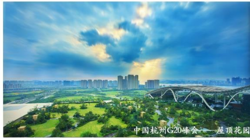
中国杭州G20峰会——屋顶花园

Hangzhou Landscape Architecture Design Institute Co., Ltd.