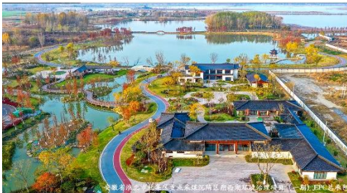
安徽省滁州市琅琊山景区提升工程（一期）EPC总承包