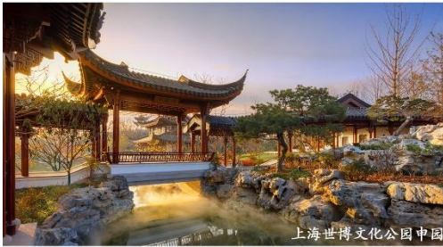
上海世博文化公园中国