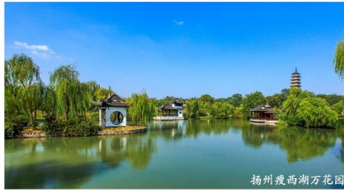
扬州瘦西湖万花园