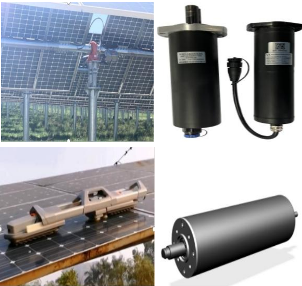
上图为公司新研发太阳能跟踪系统回转电机和太阳能面板清洗机器人电机

2022 年公司聚焦主营业务的同时，充分发挥自身在减速电机领域积累的技术优势和客户资源优势，优化升级公司产品结构和业务结构，满足客户个性化定制产品需求。目前已经完成了太阳能回转驱动行业龙头减速电机的小批量供货，未来将进一步开拓公司第二增长曲线。