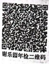
谢乐园年检二维码

本证书经检验合格，继续有效一年。 This certificate is valid for another year after this renewal.