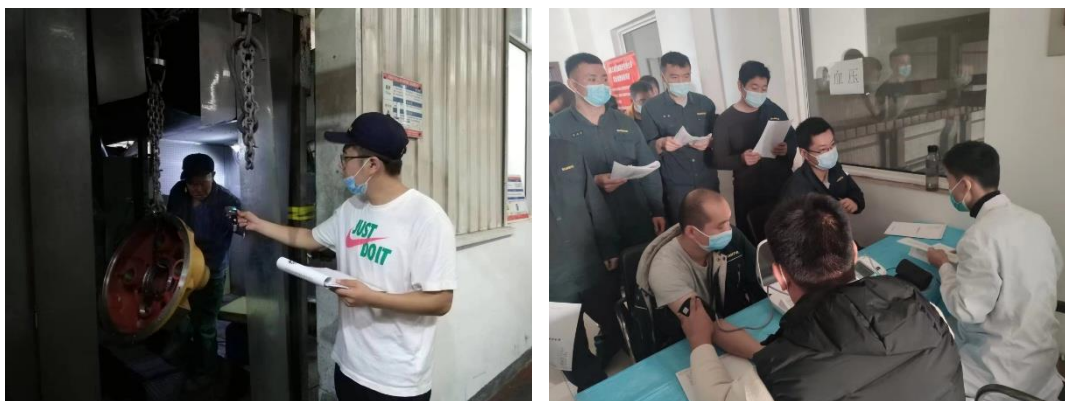
职业危害点监测和职业健康查体

实现接触职业危害因素人员实时追踪、动态管控，利用数字化数据对比，对职业健康查体异常人员，提前预警，对违规上岗、离岗人员进行重点监控。精准完成 159 处 323 项职业病防治现状检测与对标分析，达标率远高于国家、行业标准；组织 569 名职业病接害人员在岗期间查体，采样、体检率均达到 100%，未发现疑似病例，合格率 100%。为接触职业危害的员工配备满足作业环境要求的各类劳保防护用品，持续跟踪危害因素检测结果和接害员工健康状况变化趋势，落实专项整改，保障员工职业健康安全。