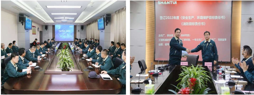
年度安全生产工作会议

公司每年与各职能部门、主机厂、事业部、分/子公司签订“年度安全生产目标责任书”，从年度控制指标、关键事件指标、工作指标三维度明确、细化全年考核目标；建立覆盖全员全岗位的“安全生产责任制”，分层级制定 357 个安全生产责任清单，将安全管理压力层层传导，提高安全生产目标的合理性、针对性。