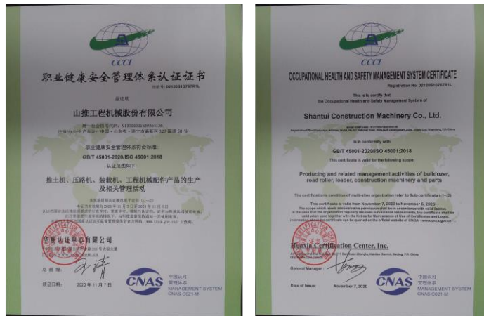
ISO45001 职业健康安全管理体系认证证书

公司高度重视安全文化建设，持续推动安全文化发展，保持安全文化充盈活力，在“明责任、重落实、抓预防”为核心的安全文化基础上，不断创新安全管理方法，通过强化源头管理、规范管理和标准化管理，初步形成了具有公司特色的管理理念、工作方法和安全文化体系，为员工的幸福安康，公司健康、持续发展奠定了坚实的基础。