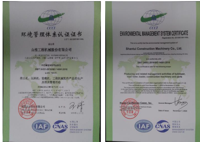
ISO14001 环境管理体系认证证书

公司 ISO14001 环境管理体系一直保持有效运行和持续改进，2022 年通过体系监督审核，围绕“遵法守纪、明确责任、预防为主、全员参与、持续改善”，建立长效改进机制，持续提高环境绩效。