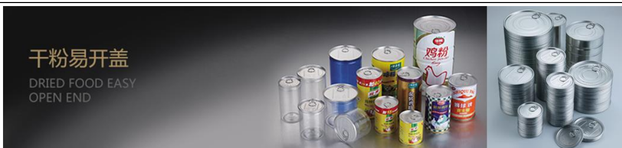
上图：干粉易开盖应用及公司产品