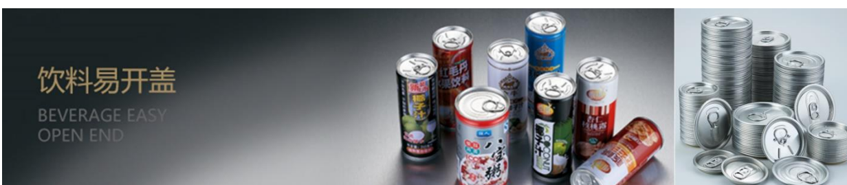
上图：饮料易开盖应用及公司产品