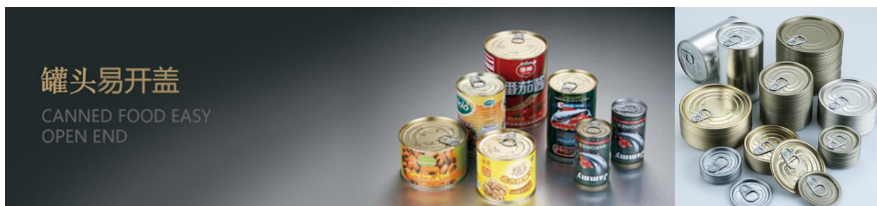
上图：罐头易开盖应用及公司产品