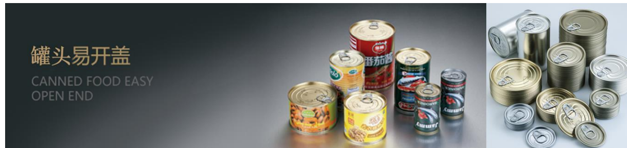
上图：罐头易开盖应用及公司产品