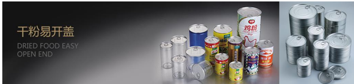
上图：干粉易开盖应用及公司产品