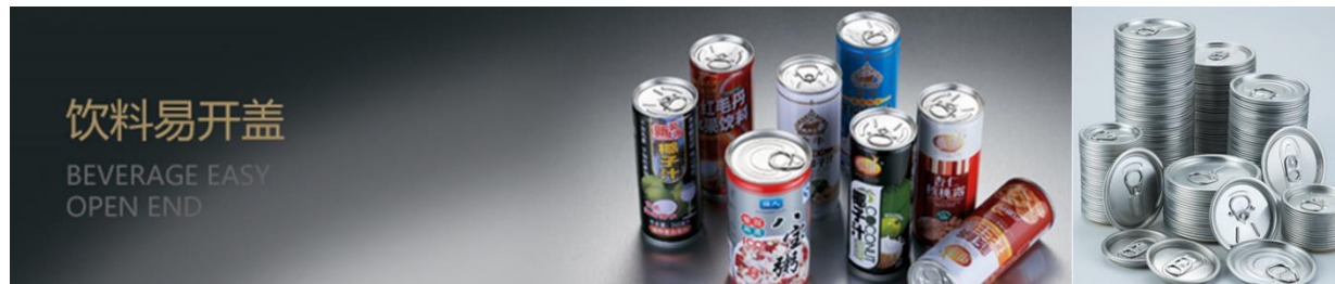
上图：饮料易开盖应用及公司产品