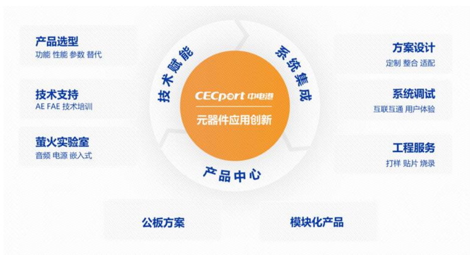
图：萤火工场服务内容

技术方案开发服务主要聚焦公司分销业务核心增长行业，为客户提供模组设计方案，并提供开发工具和调试例程等测试开发服务。该服务一方面能协助客户提升产品设计效率，快速推出产品占领市场，另一方面能拓展公司电子元器件产品应用场景，实现公司业务领域的快速扩张。公司主要围绕自身核心产品线进行模组方案的设计，同时引进部分外部 IDH 的模组方案，为客户提供需求匹配的模组产品。目前公司已在网信系统、射频技术、汽车电子、电源管理、智慧视觉、无线通讯等领域积累了一定的技术方案开发实力。