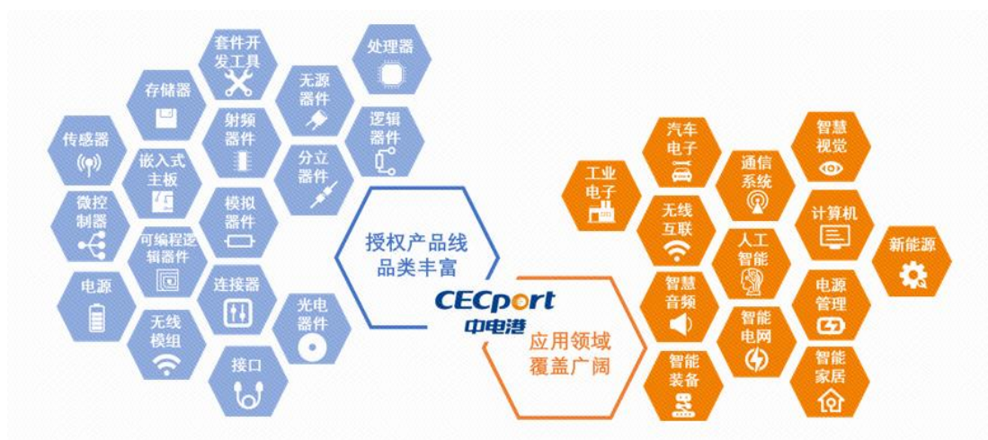
图：授权分销业务产品分类和行业应用领域

区域布局方面，为提高响应速度、更好地为客户提供服务，公司在深圳、上海、北京、成都、武汉、香港、台北以及新加坡等设有 50 个办事处，遍布电子信息产业核心区域。