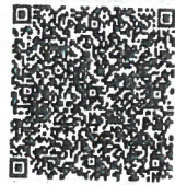
四川省注册会计师协会 已年检二维码

本证书经检验合格，继续有效一年。 This certificate is valid for another year after this renewal.