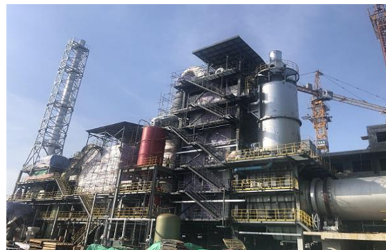
海南洋浦港危险废物处理中心项目