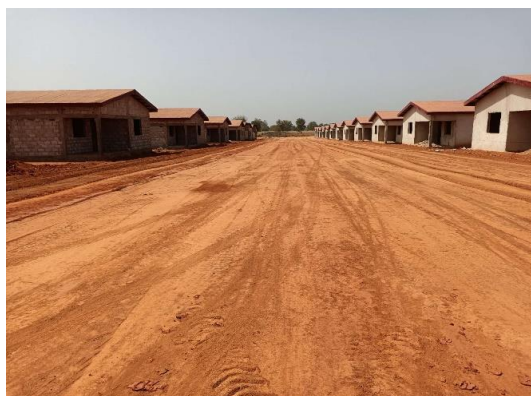
科特迪瓦旱港建设项目