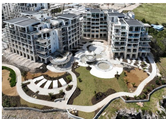
巴巴多斯山姆罗德酒店项目