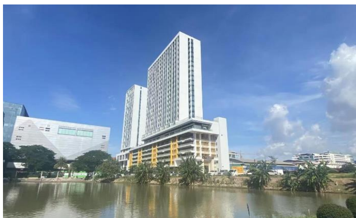
老挝万象生活中心项目