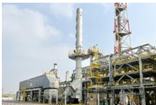
中央废气处理及能量回收项目

报告期内，扬子石化-巴斯夫有限责任公司中央废气处理及能量回收项目在南京正式投料成功，该项目依托于亚德公司先进的危废处置技术和工艺安全设计，将一体化基地各装置的二十多股废气集中收集、无害化处理后进行能源回收，并针对复杂工况，同步开展脱硝和挥发性有机气体 (VOC) 治理，实现了节能、减排和降碳的协同处理。项目投用后，全年可产生 27 万吨蒸汽，回收的能量用于一体化基地生产，将减少 576 万标立的天然气消耗，进一步减少扬子石化-巴斯夫的碳足迹。