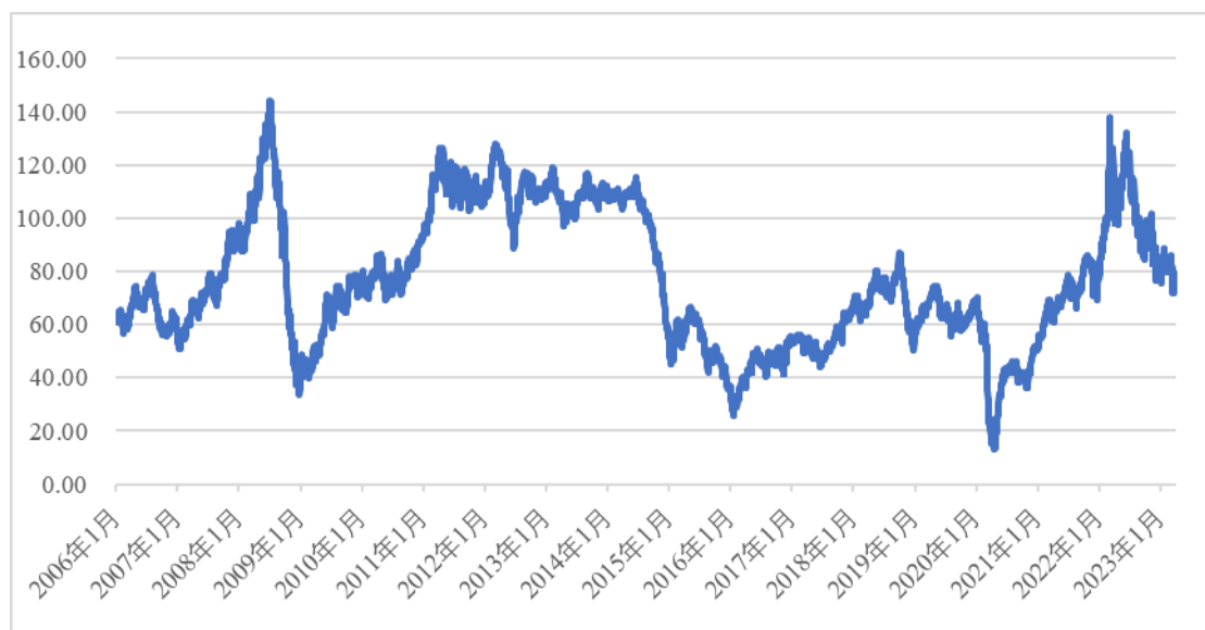
国际原油（英国北海布伦特）油价变动情况（单位：美元/桶）

随着世界经济形势的变化、石油开发投资规模波动等诸多因素的影响，本公司会面临石油天然气行业周期性波动，导致潜油泵电缆、连续油管、液压控制管等油服领域销售收入、经营业绩波动的风险。