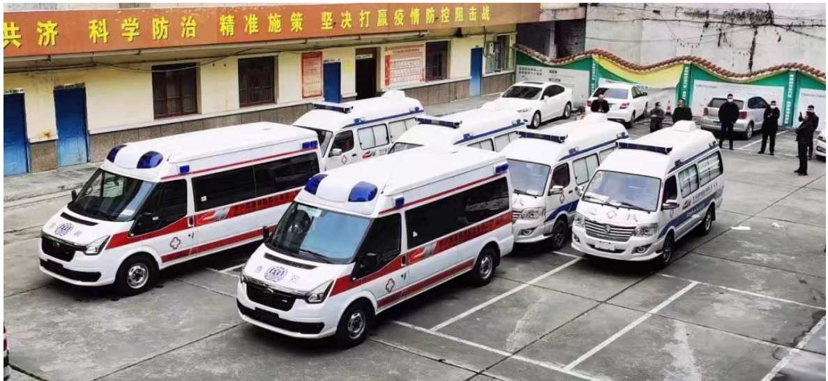
京沪高铁所捐赠医疗救护车