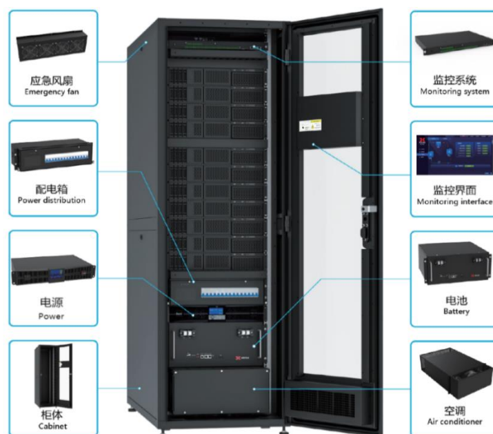
图：一体化机柜结构图

也可以与电源类、电池类产品集成为一体化机柜进行销售。与分布式安装不同，采用一体化机柜方案，可以节省安装空间，提升安装效率，降低维护成本。一体化机柜产品主要形态如下图所示：