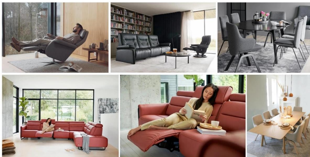
Stressless山姆Sam电动椅、Stressless Mary沙发 / Mayfair舒适椅、Mint轻便椅、Emily沙发、月桂餐厅系列

曲美家居坚持以用户需求为中心，以契合消费者需求的品牌定位、一站式全品类布局、强大的产品研发和制造实力、境内外品牌合力发展，与时俱进，形成品牌增长新势能。