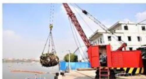
水域垃圾干燥、压缩