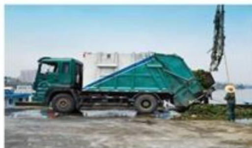
“集中收料”及时压缩