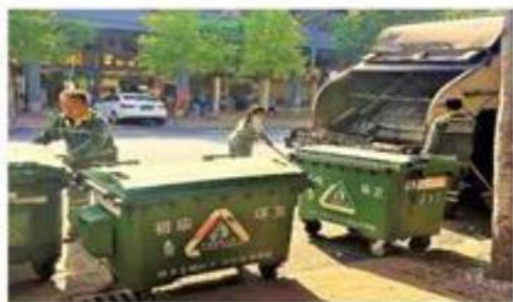
“沿途上料”并及时压缩