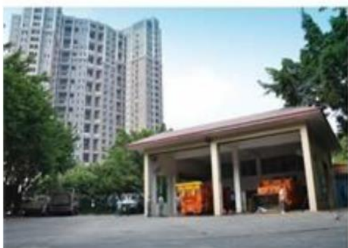
垃圾压缩中转站全貌