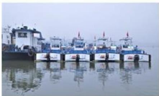
全自动保洁船作业