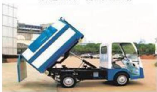
“以箱换箱”垃圾运输车