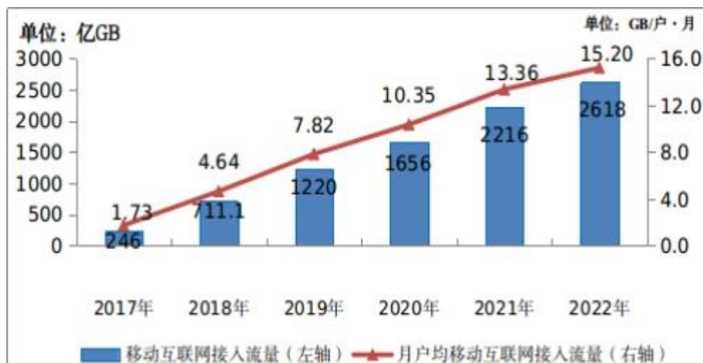
▲ 2017-2022 年移动互联网流量及月 DOU 增长情况

2022 年，移动互联网接入流量达 2618 亿 GB，比上年增长 18.1%。全年移动互联网月户均流量（DOU）达 15.2GB/户·月，比上年增长 13.8%；12 月当月 DOU 达 16.18GB/户，较上年底提高 1.46GB/户。