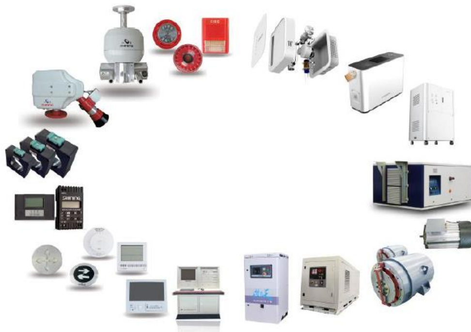
电力电子装备示意图

电力电子板块由消防报警设备、制氧设备业务组成，其中消防报警设备是该板块核心业务。消防报警设备依托于全资子公司山鹰报警，主要产品有火灾报警控制系统、智能应急照明和疏散指示系统、防火门监控系统、电气火灾监控系统、消防设备电源监控系统、图像型火灾探测系统、自动跟踪定位射流灭火系统、家用火灾报警系统、可燃气体报警系统等16个系类366种型号,并提供典型行业应用解决方案。制氧设备作为医疗板块重要协同，可应用于移动医疗车辆和大空间供氧，配合公司医疗板块战略布局。