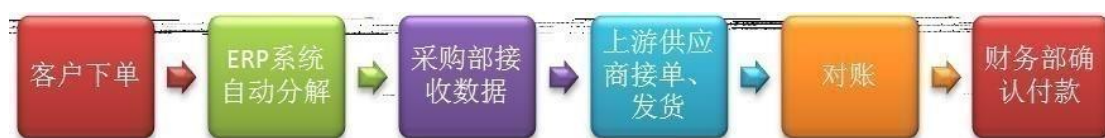
原材料采购下单流程

公司建立严格的原材料供应商备选制度，对原材料供应商的服务、规模、交货能力以及价格进行综合考评。公司原材料采购下单由微软ERP系统自动生成。销售部门接到客户订单后，ERP系统根据内部生产表设定原材料采购数量，并自动将数据分解后送至采购部，由采购部联系上游供应商下单。目前采购部门人员配备完善，工作职责定位清晰。在供应链管理方面，建立在双方信任和紧密合作的前提下，公司要求某些特定材料的供应商建设HUB仓制度（即原材料预先存放在公司的仓库，领用材料时才视同提货）。公司通过订单系统将建立HUB仓制度的原材料的日存货数据每日整理提交供应商，原材料供应商则根据HUB仓剩余的材料数量下达发货指令。HUB仓制度在采购流程上与普通采购流程无大差别，但在生产中更加有利于公司原材料提用和生产顺利进行。目前，采用HUB仓模式的主要是主材FCCL、屏蔽膜、化学品和部分通用元器件的供应商。