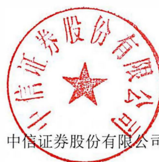
中信证券股份有限公司