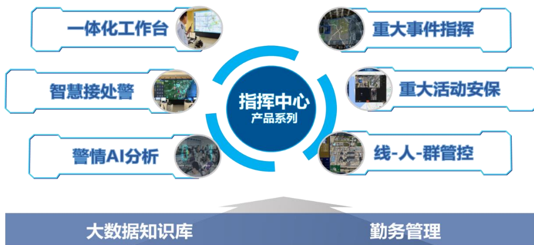
指挥调度平台产品族

报告期内，公司继续扩充NLP模型及数据标签数量，深化NLP应用，截至目前，公司构建了2000余细类的业务标签体系，实现了一系列智能化应用模型和实战场景，已在湖北、四川等省投入使用，帮助客户进行智能决策。在海外，公司发布了新型易部署的小型化指调平台产品，在东盟、拉美、非洲等地区实现推广。