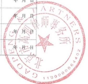
律师事务所变更登记 (二)