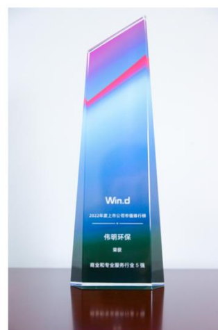
商业和专业服务行业5强

报告期内公司经营情况的重大变化，以及报告期内发生的对公司经营情况有重大影响和预计未来会有重大影响的事项