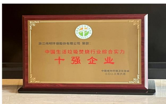
中国生活垃圾焚烧行业综合实力十强企业

报告期内，公司成功开展第二期限制性股票激励计划，拟授予总量不超过 1,303 万股，其中首次授予限制性股票 1,043 万股，并于 6 月底完成首次授予登记。公司推进第四期可转债的审核工作。公司还荣获中国城市环境卫生协会“中国生活垃圾焚烧行业综合实力十强企业”、董事会杂志“第十八届中国上市公司董事会金圆桌奖之公司治理特别贡献奖”、万德咨询“2022 年度上市公司市值排行榜之商业和专业服务行业 5 强”称号。