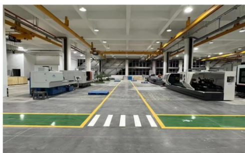
伟明设备成套环保装备制造产业基地