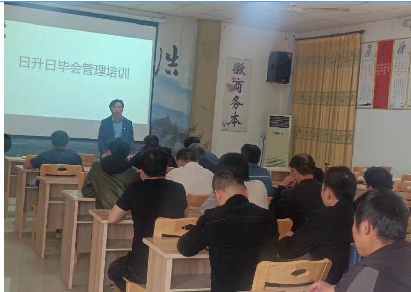
图3 生产中心 日升日毕会培训