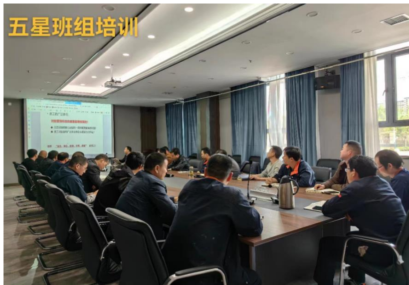
图2 生产中心五星班组培训

公司聚焦效能提升，今年继续与外部咨询机构合作，进一步优化运营流程，加强综合计划管控，加强财务预算管理，加强团队建设、3C 人才培养，并围绕交期、质量开展五星班组建设，加强激励与约束，强化内部督查；并加强基层一线人员技能培训，努力提质、降本、增效。