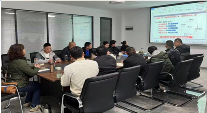
图1 营销中心培训现场