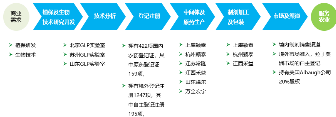
颖泰生物全产业链商业模式图