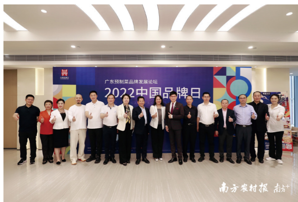
▲ 2022广东预制菜品牌发展论坛

系列活动线上线下总参与人数突破30万人次，成功联动政府、品牌、专家等多方力量，为广告营销企业开拓了新的业务赛道，创造了多赛道交流和合作的商机。