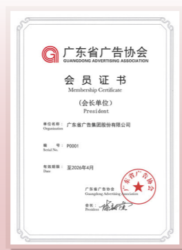
▲ 广东省广告协会会员证书