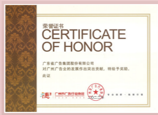
◀ 荣获广州市广告行业协会“广州广告行业突出贡献荣誉证书”