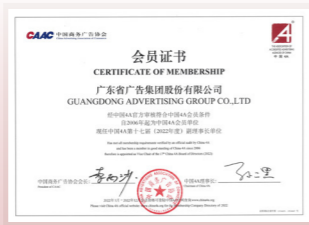
◀ 中国商务广告协会会员证书