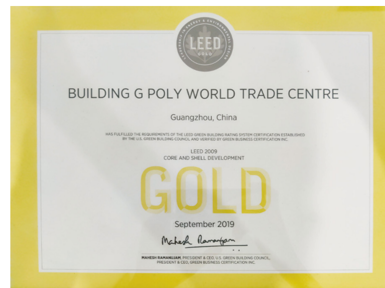
▲ LEED绿色建筑金级认证证书展示

省广集团总部办公所在地已获得LEED绿色建筑金级认证，进一步推动集团建立绿色、低碳、可持续的办公体系，助力达成双碳目标。