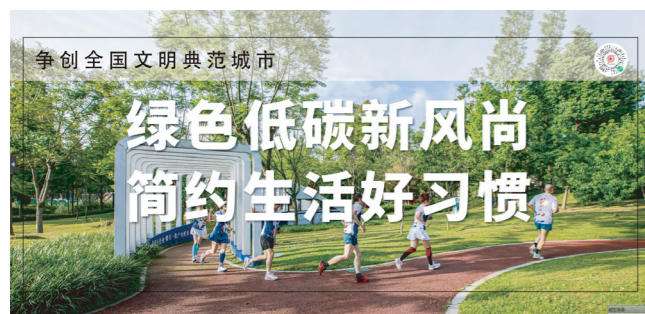
▲ 省广集团环保宣贯案例展示1

省广集团凭借自身的媒体平台优势向外界传播环境保护理念，充分发挥广告企业的号召和示范作用。同时，公司还策划组织员工参与清山净野环保活动，寓教于乐，切实提高员工环保意识和责任感。