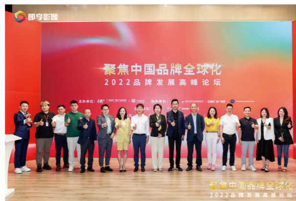
▲ “聚焦中国品牌全球化”2022品牌发展高峰论坛