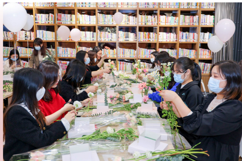
▲ 女神节DIY手艺人园游会活动