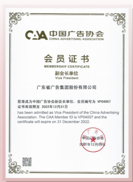
▲ 中国广告协会会员证书