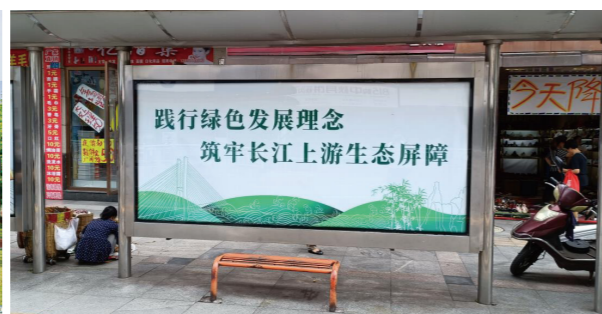
▲ 省广集团环保宣贯案例展示2

省广集团将秉持绿色经营和节能环保的经营理念，努力向低碳运营转型，并持续倡导员工节约资源，减少污染及环境保护意识，让可持续发展的理念与公司企业文化相结合，以实际行动助力国家减碳目标。