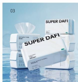
03 答菲绵柔洗脸巾 规格：100抽；