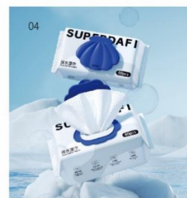
04 答菲纯水湿巾 规格：80抽；