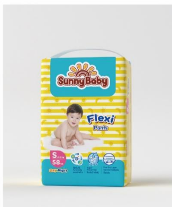
Sunny baby FLEXI