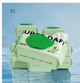
01 答菲湿厕纸 规格：100抽家庭装， 40抽尝鲜装，10抽便携装；