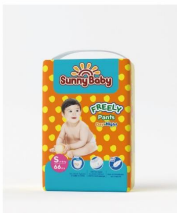
Sunny baby FREELY