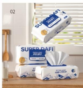
02 答菲厨房湿巾 规格：80抽；