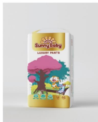
Sunny baby LUXURY