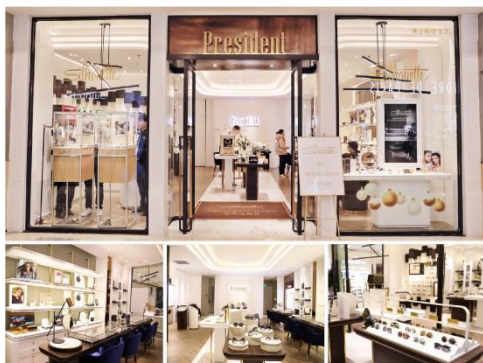
· President optical 门店 ·