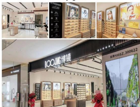
· Boojing 门店 ·