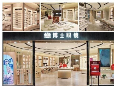
· 博士眼镜门店 ·