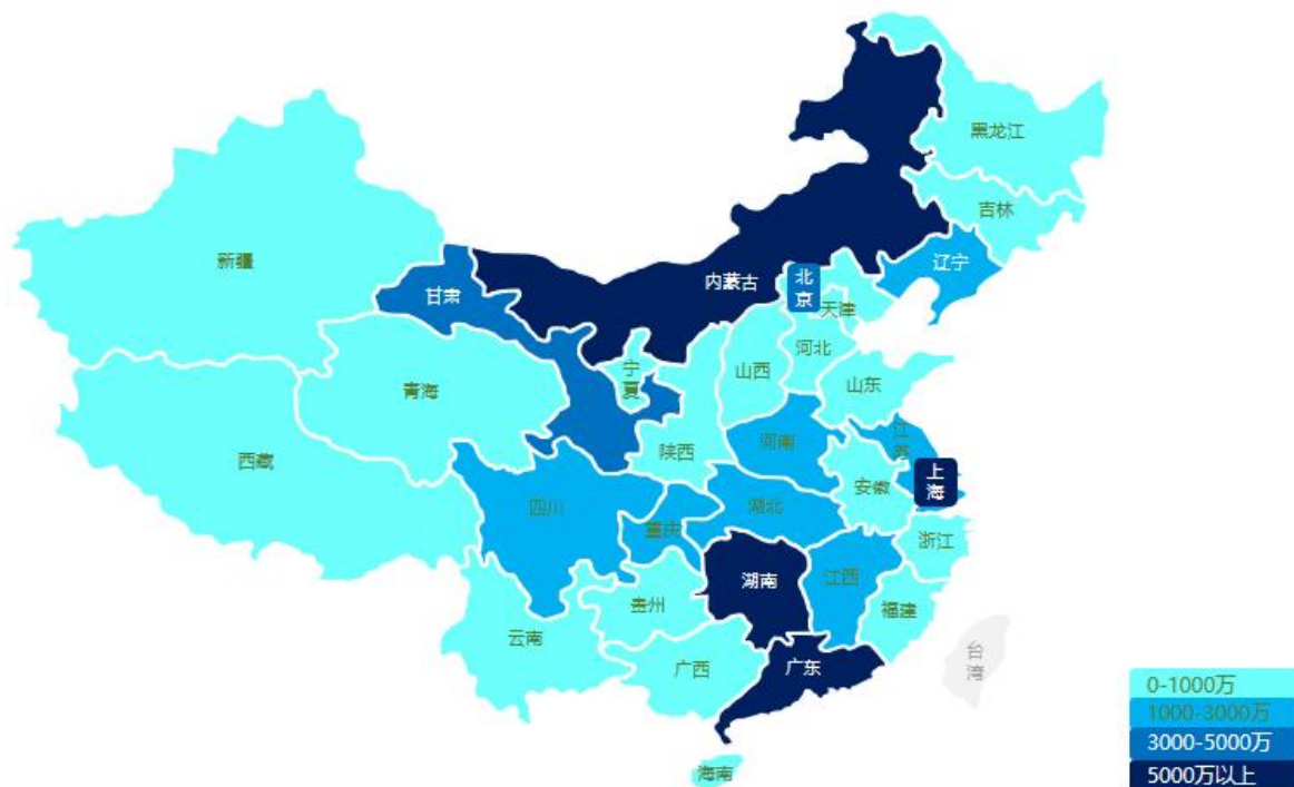
过去三年公司电力行业业绩分布

报告期内，公司中标了国家电网、南方电网多个数字能源及物联应用建设项目，凭借行业领先的技术实力，积极发挥主营业务优势，在物联接入、边缘计算、数据服务、数据分析、数据应用、数据展示等方面，为国家电网、南方电网实现数字化转型提供了强有力的技术支撑。