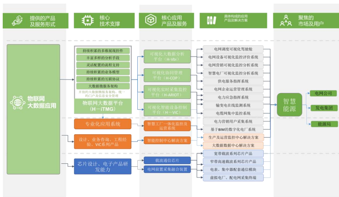
技术及产品战略图

技术及产品创新是公司可持续发展的根本。公司在确立以物联网大数据为战略发展方向的前提下，取公司已有技术研发成果之精华，通过创新、升级形成公司的面向物联网大数据核心技术平台是公司未来三到五年的主要研发战略目标。