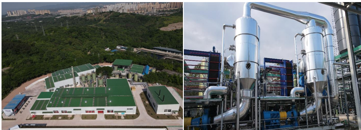
公司高浓度污水处理服务项目