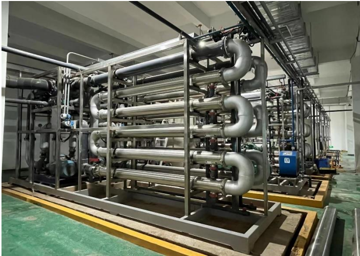
华电六安电厂管式膜软化除硬项目-管式超滤膜设备