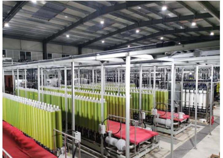
中石油长汀催化剂高含盐废水处理项目-DT膜设备