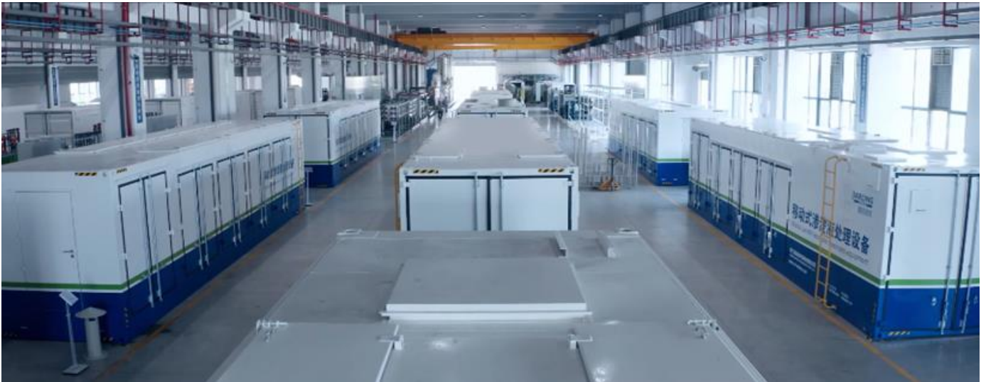
集装箱式可移动式成套设备产品